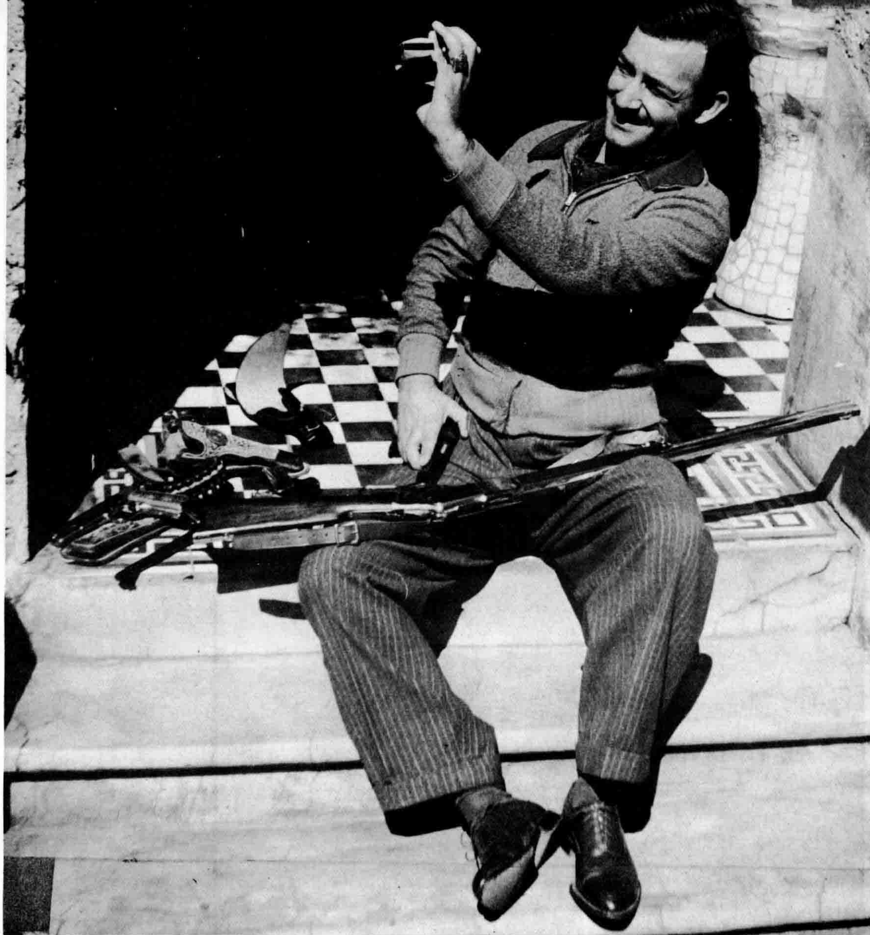
IMAGEN DE LA virilidad mexicana, el cantante que desertó de la ópera, ganó amplísimos públicos en las pantallas de cine. Aquí, con Domingo Soler en la película Historia de un gran amor . No cabe duda, el histrión era una figura de armas tomar, como lo demuestra en su casa en 1949